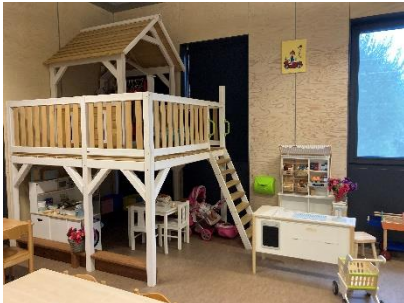
Huishoek en winkel