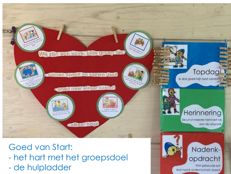
Goed van Start: - het hart met het groepsdoel - de hulpladder

Iedereen is anders, iedereen hoort erbij!